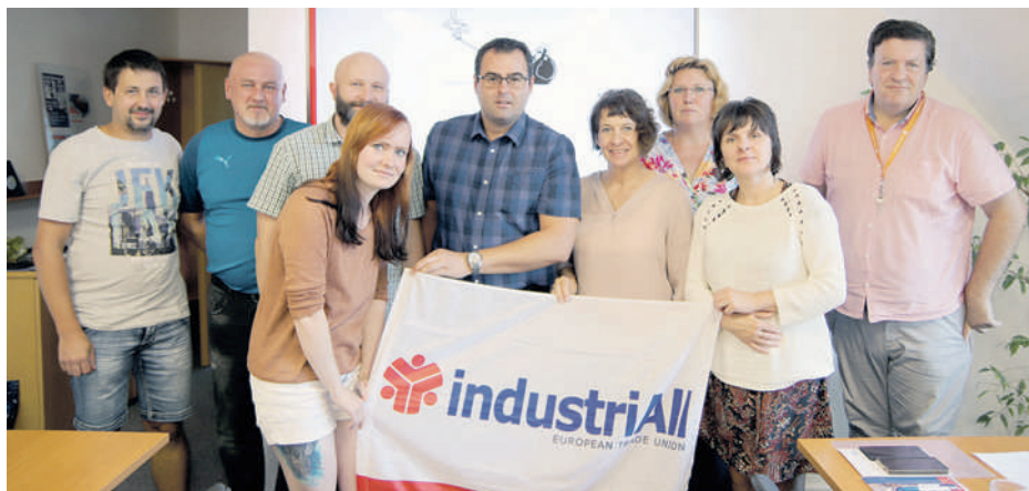
Kováři se v Hradci Králové zaměřili na nové metody rozvoje odborů

nadace založená v Polsku na základě rezoluce „Měníme Evropu budováním odborů“ přijaté na VI. Konferenci UNI Europa v Římě. Jde o nezávislou nevládní organizaci sdružující organizátory a školitele – experty na vedení organizačních kampaní zaměřených na podporu růstu odborů. Jejím posláním je podpora revitalizace a rozvoje odborů v Polsku, České republice a Maďarsku. (jom)