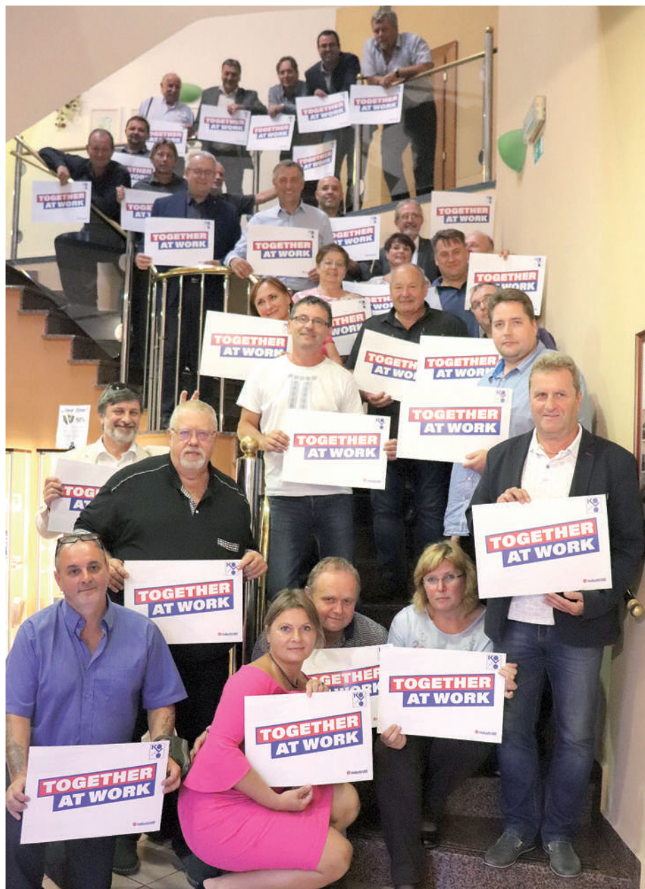
OS KOVO se přidává ke kampani „Together at work“

„Prosazovat kolektivní vyjednávání na odvětvové, a především podnikové úrovni za pomoci celé struktury zaměstnanců OS KOVO jako nejdůležitější nástroj pro zlepšování pracovních, mzdových a sociálních podmínek zaměstnanců“ a „Připravovat vyjednávací týmy i v těchto nejmenších ZO co nejvíce profesionálně, dbát na přípravu podkladů ve spolupráci s RP a specialisty OS KOVO a motivovat vyjedna-