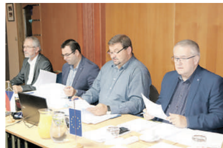
Členové výkonného vedení OS KOVO přednesli aktuální informace