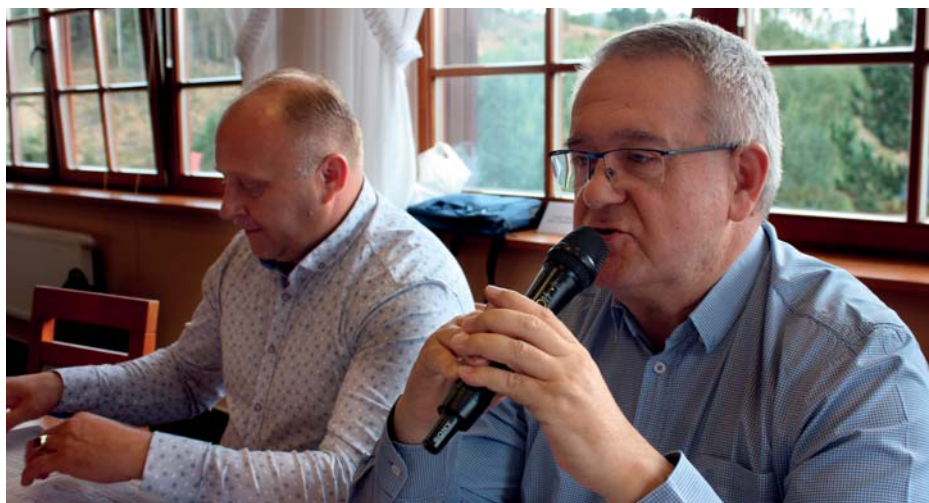
Výsledkem nedávného mezinárodního jednání na Těšínsku je společná deklarace.

míst. Žádá dotační opatření na podporu rekvalifikace a školství. Chce, aby byly evropským ocelářům zajištěny rovné podmínky na globálním trhu, prosazuje přijetí ochranných regulačních opatření a v krizovém období také pozastavení procesů zpřísnování ekologických limitů. Definuje požadavky na energetickou politiku EU i jejích členských zemí z pohledu cen, investic a emisních povolenek. Zmiňuje zachování těžby černého uhlí pro potřeby domácích hutí a zahrnuje také změny v systémech odměňování zaměstnanců i v důchodových systémech. (jom)