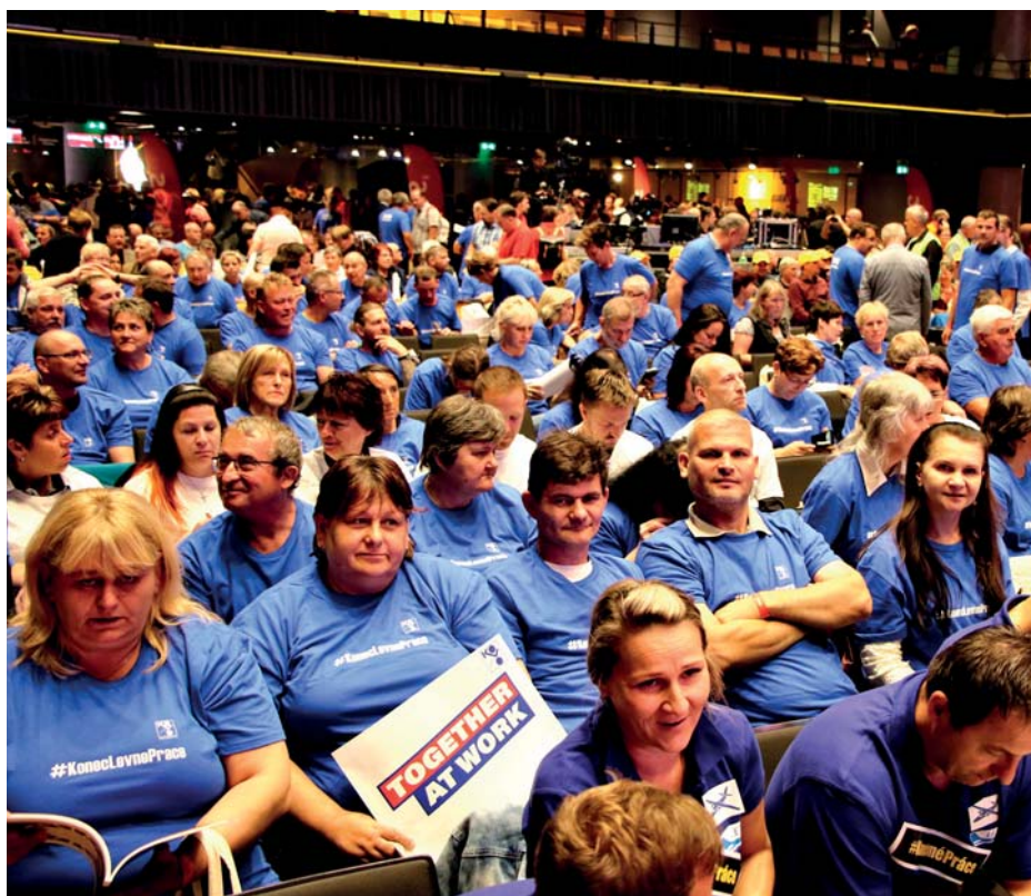
Největší podíl v publiku na mítinku za Konec levné práce tvořili kováči.