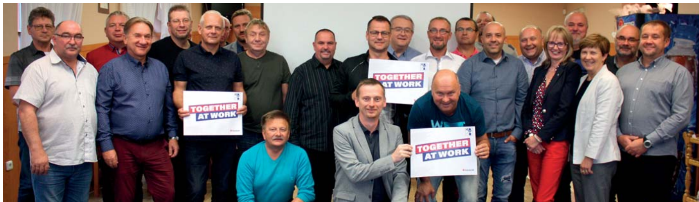
Celoevropskou kampaň Together at work podpořili i odboráři na jednání v Dolní Lomné.